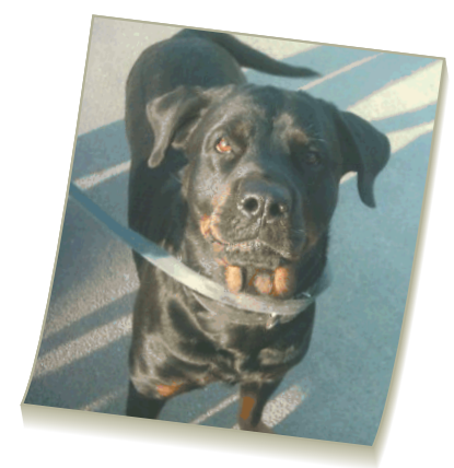
Gina aus Elbe