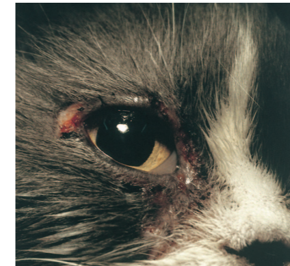
Typische Veränderungen an den Augenlidern bei einer Katze mit Nahrungsmittelallergie

Bei Katzen gestaltet sich die Abklärung schwieriger. Hautallergietests sind nur mit Vorbehalt einsetzbar, Bluttests werden erst seit kurzem durchgeführt und müssen kritisch gesehen werden,