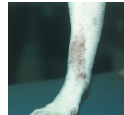
Entzündliche Hautveränderung bei einem Hund mit Allergie

d.h., der Organismus kann z.B. bestimmte Pollen nicht von bestimmten Nahrungseiweißen unterscheiden. Ein Beispiel hierfür ist die Kreuzreaktion beim Menschen auf Hausstaubmilben und auf Schalentiere aus dem Meer. Ein Hausstaubmilbenallergiker muss also auch auf eine leckere Krabbenmahlzeit verzichten. Andererseits ist auch noch wenig über allergische Reaktionen auf Hilfsstoffe eines Futtermittels bekannt, z.B. künstliche Aromastoffe, Stabilisatoren, Konservierungsstoffe, Farb- und Lockstoffe oder Geschmacksverstärker, um nur einige zu nennen.